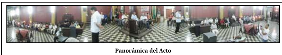
Panorámica del Acto

Dando pasos firmes y seguros arribó al aniversario 99 de fundada el pasado 27 de Agosto la Respetable Logia JOSÉ MARTÍ de Palma Soriano en la provincia Santiago de Cuba. Nuevos aires soplan, oxígeno renovado se respira como comienzo del camino al centenario.