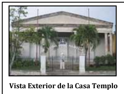
Vista Exterior de la Casa Templo

Dando pasos firmes y seguros arribó al aniversario 99 de fundada el pasado 27 de Agosto la Respetable Logia JOSÉ MARTÍ de Palma Soriano en la provincia Santiago de Cuba. Nuevos aires soplan, oxígeno renovado se respira como comienzo del camino al centenario.